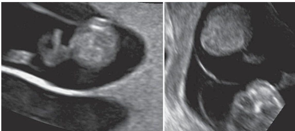
Eerste trimester echoscopie. Links full lambda sign van een dichoriale tweeling en rechts empty lambda sign van een monochoriale tweeling.

De sensitiviteit en de specificiteit van een afwezige (full) lambda sign voor het vaststellen van monochorioniciteit waren in een studie van 410 monochoriale placenta's respectievelijk 89,8 en 99,5%. 9